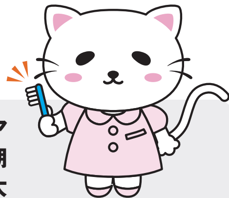
横浜市医療対策マスコットキャラクター イリヨーネ

全身麻酔手術や抗がん剤治療の前後に、お口のケアを行って思わぬトラブルを予防することを、周術期等口腔機能管理といいます。お口のケアを受ける大切さを知っていただくための講演会を開催します。